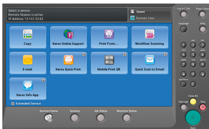
Interfaz de usuario con todas las aplicaciones Xerox® ConnectKey.